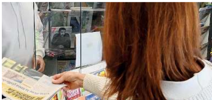
L'appello. Gli edicolanti chiedono più tutele

La crisi della società di distribuzione dei giornali è finita in Tribunale