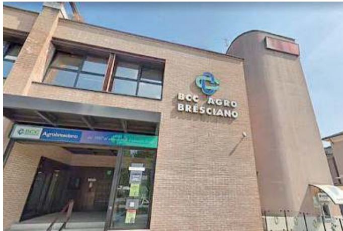
A Ghedi. La sede della Bcc Agrobresciano

Ampliata la rete delle filiali rafforzata la solidità patrimoniale